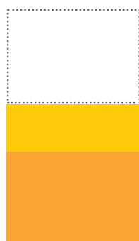
Monatl. Rente später